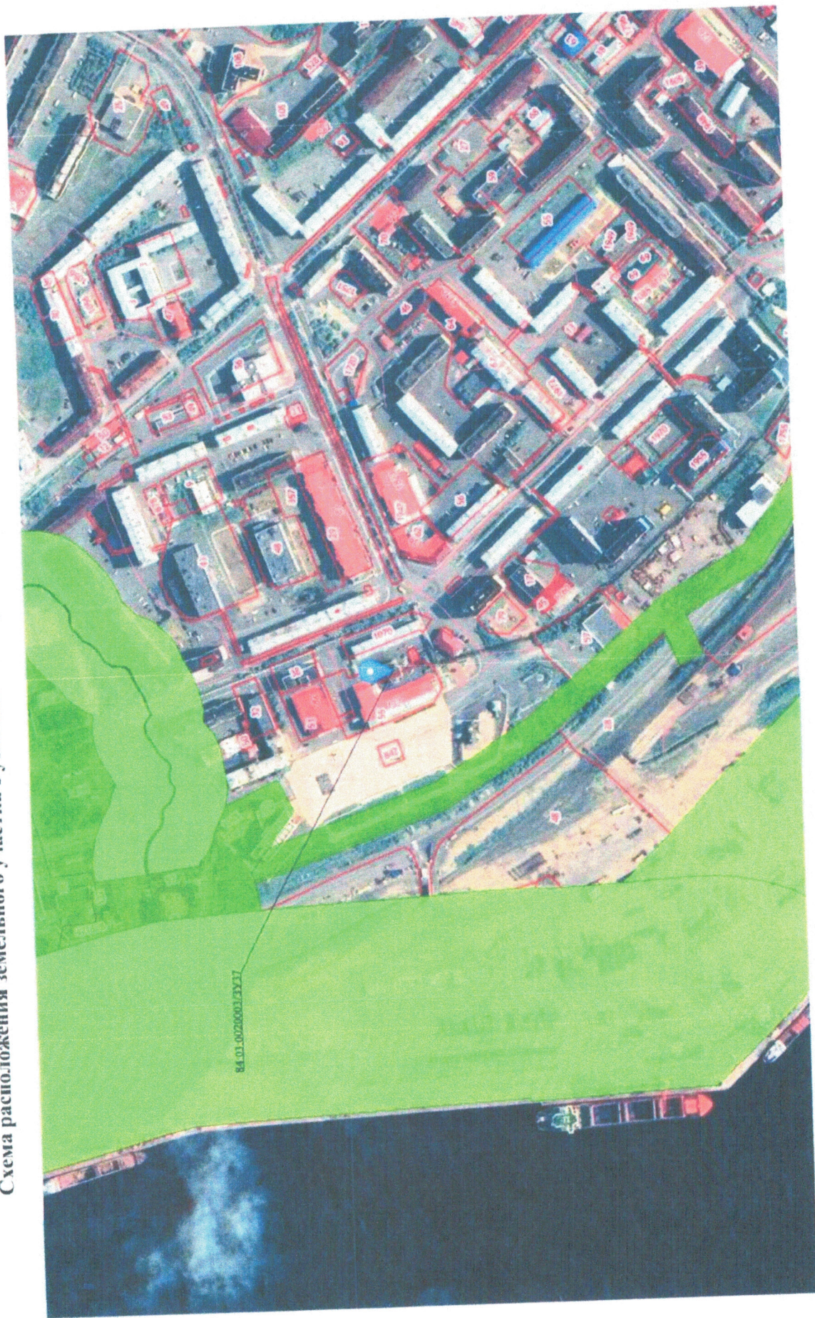
Схема расположения земельного участка с условным номером 84:03:0020003/3У37 площадью 280,83 кв.м.

Приложение к постановлению Администрации Таймырского Долгано-Ненецкого муниципального района от 18.01.2023 № 40